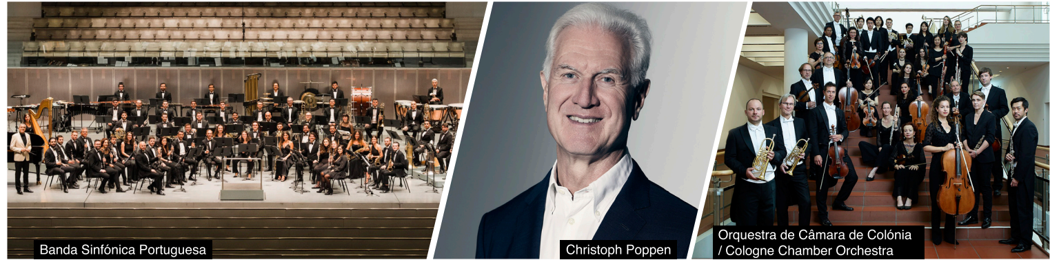
Banda Sinfónica Portuguesa