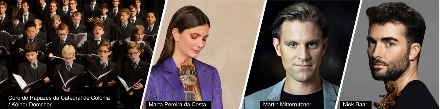
Coro de Rapazes da Catedral de Colónia / Kölner Domchor